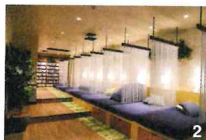
1.カプセルユニットに加え、収納スペース付きデラックスユニットも 2.共有スペースのソファにはカーテンがあり、読書に熟中できる