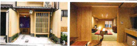
1.古い町家は快適に過ごせるようにリノベーションされている。2Fの寝室はベッドと布団を選ぶことができる 2.1Fは坪庭のあるくつろぎスペース 3.格子のあるお茶屋風の玄関