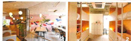
1.かわいいおうち型の個室。鴨川の見える客室もある 2.ドミトリーは1室に4ベッド 3.1Fのカフェは写真映える空間。パンケーキなどがかわいいスイーツのほか、ピクニックセットなども