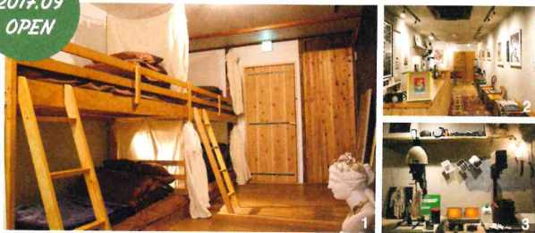
1.男女混合部屋のほか、女性専用ドミトリ(写真)と個室がある 2.レセプションには味わい深い銀塩写真作品を展示 3.バーの閉店後、朝6:00までラボで現像ができる