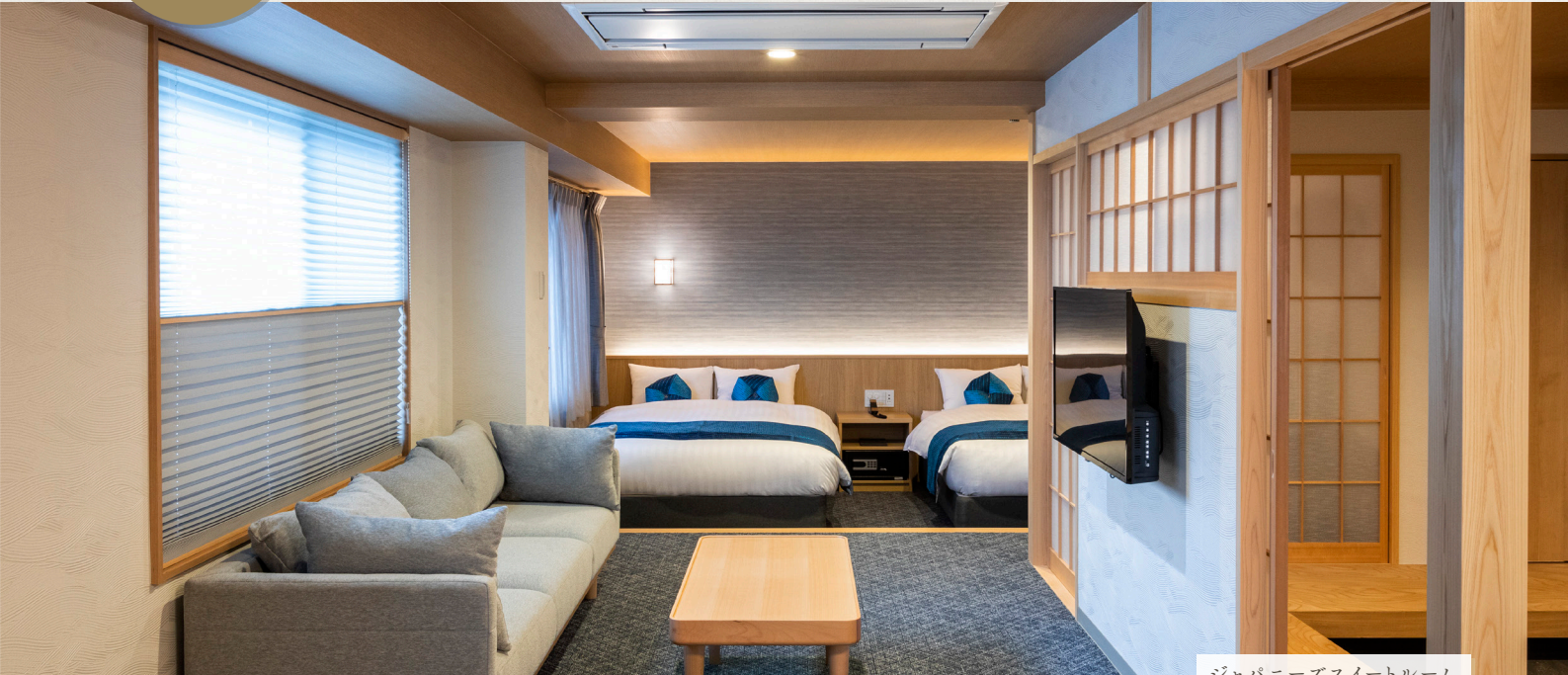
ジャパニーズスイートルーム