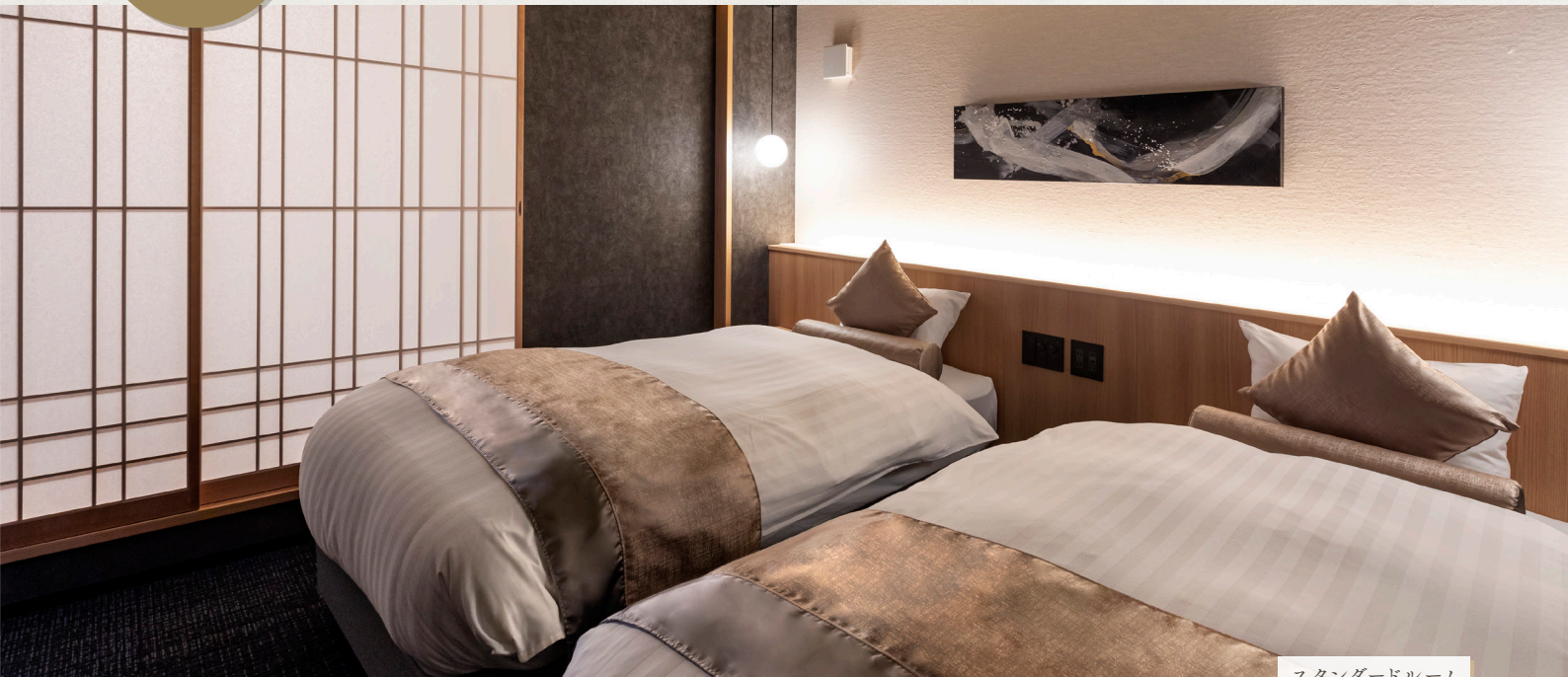
スタンダードルーム