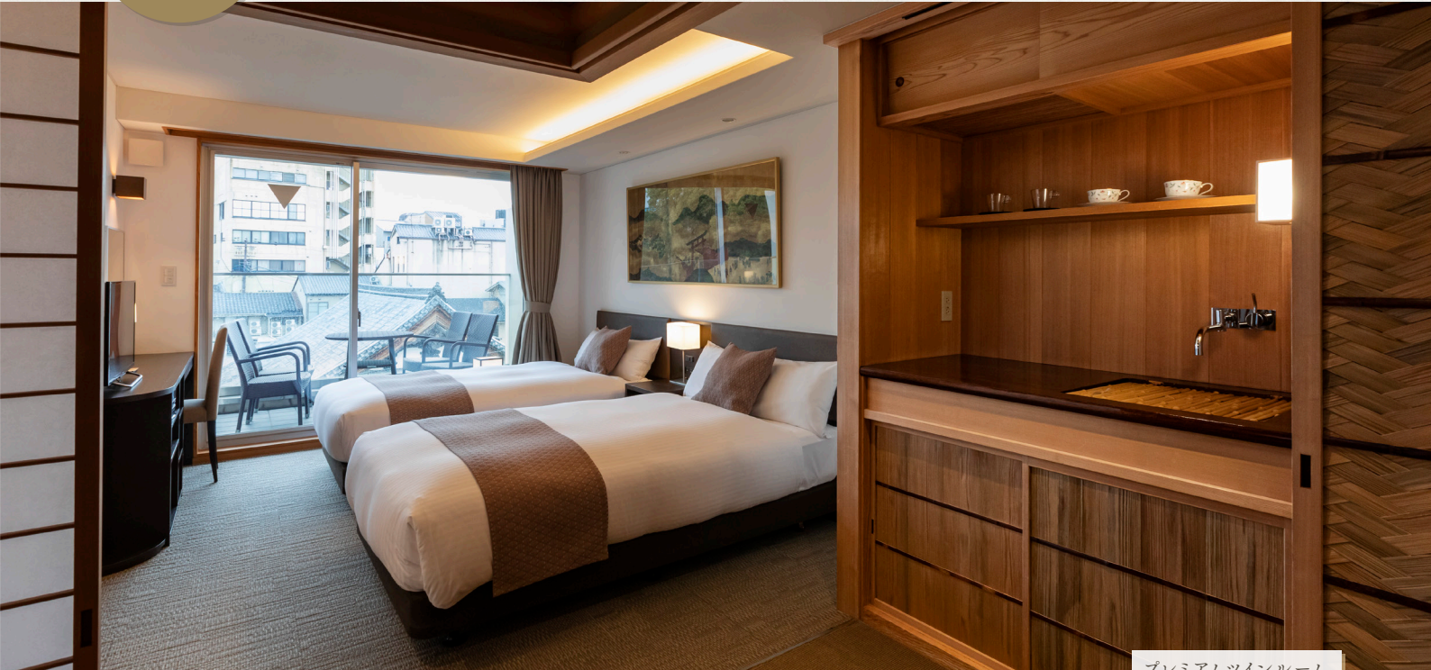
プレミアムツインルーム